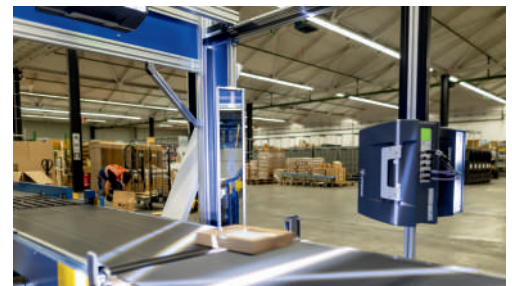
OCR- UND BARCODEERKENNUNG

Ein Wartungskonzept mit voller Garantie während der gesamten Vertragslaufzeit (bis >10 Jahre) rundet das Angebot ab.